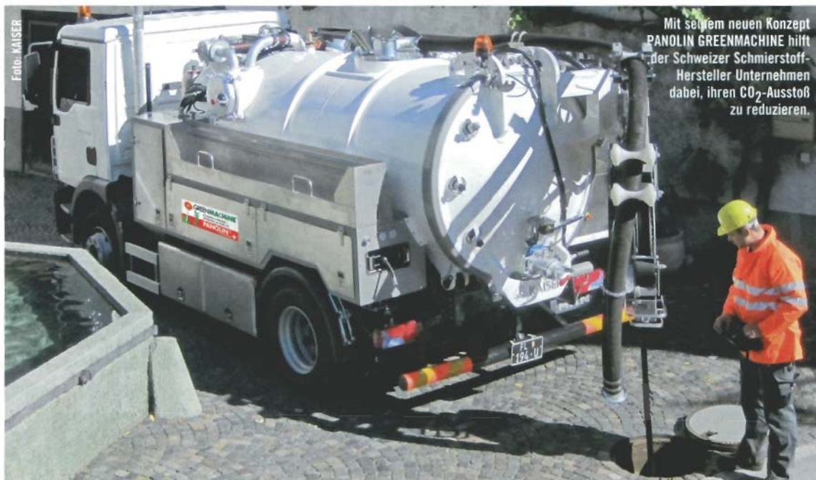
Mit seinem neuen Konzept PANOLIN GREENMACHINE hilft der Schweizer Schmierstoff-Hersteller Unternehmen dabei, ihren CO 2 -Ausstoß zu reduzieren.