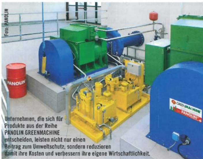
Unternehmen, die sich für Produkte aus der Reihe PANOLIN GREENMACHINE entscheiden, leisten nicht nur einen Beitrag zum Umweltschutz, sondern reduzieren damit ihre Kosten und verbessern ihre eigene Wirtschaftlichkeit.

Eine ganze Palette von PANOLIN ECLs fließen auf Grund ihrer ökologischen Eigenschaften und der Tatsache, dass sie sich für einen eklatant verlängerten Einsatz (bis hin zur Lebenszeitfüllung) eignen, bereits in das PANOLIN GREENMACHINE Konzept ein. Neue Produktentwicklungen mit neuester Technologie, hervorragenden Leistungen bei gleichzeitiger Schonung der Umwelt und Reduktion des CO 2 -Ausstoßes ergänzen diese Geschäftsstrategie. Unternehmen, die sich für PANOLIN GREENMACHINE entscheiden, leisten einen großen Beitrag für die Welt in der wir leben, reduzieren ihre Kosten, verbessern ihre eigene Wirtschaftlichkeit und verschaffen sich markante Wettbewerbsvorteile.