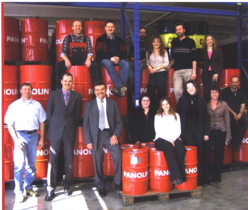
Die Mannschaft der Kleenoil Panolin Zentrale in Dogern unterstützt die Mitarbeiter und Händler in allen Regionen und Ländern (die leider nicht auf diesem Foto sein können), in denen das Unternehmen vertreten ist

und zeigt, dass hier keine Theoretiker oder Spinner am Werk waren, sondern dass wirklich Nutzen und Mehrwert geschaffen wurde und wird. Ein weiterer wichtiger Teil des Kleenoil Panolin Systems ist, dem Kunden exzellente Servicequalität anzubieten. Dazu bedarf es qualifizierter und informierter Mitarbeiter, die ein wichtiges Prinzip beachten: Man muss darüber reden, was die Produkte können. Man muss aber auch darüber reden, was die Produkte nicht können. Beides zusammen ergibt ein klares Bild und gibt dem Kunden die Möglichkeit einzuschätzen, was er an Vorteilen vom Kleenoil Panolin System für sich erwarten kann. Selbstverständlich gehören hochwertige und umweltfreundliche Schmier-